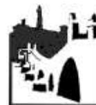
Ra Familia Bubieiza Dal 1981

COMITATO DISTRETTUALE PER LA VALORIZZAZIONE DELLE ECCELLENZE AGROALIMENTARI DEL TERRITORIO