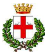
Città di Bobbio