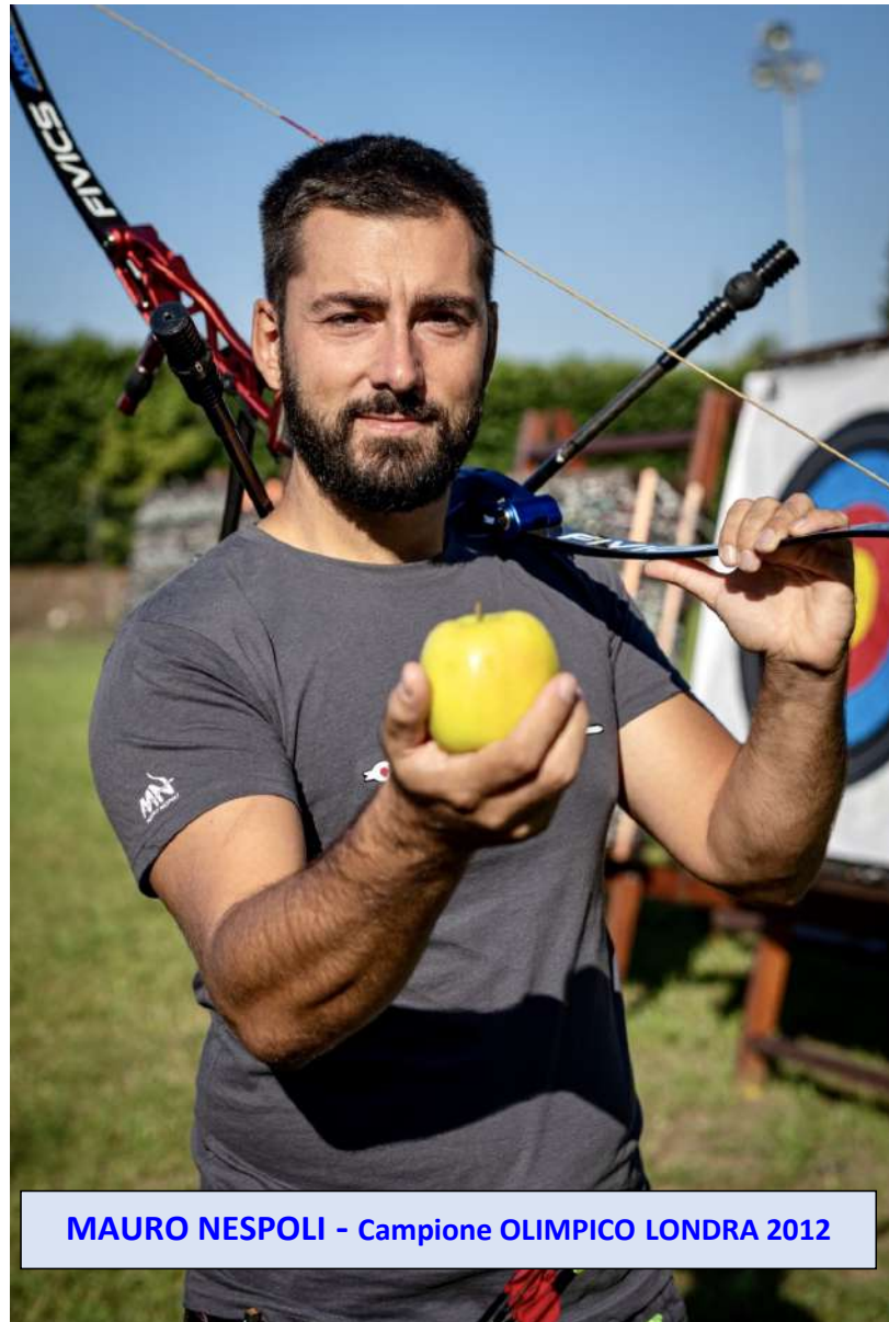
MAURO NESPOLI - Campione OLIMPICO LONDRA 2012