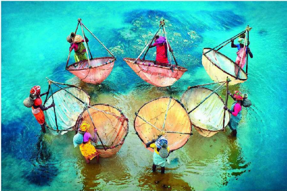
Water and Life | Pranab Basak | WWDPHC 2022

World Water Day Photo Contest 2023 Presentazione VII edizione Museo dell'Acqua Via Parigi 1b | Porto Mantovano 1 ottobre 2022 ore 9:30