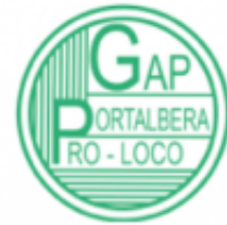
GAP Pro-loco Portalbera